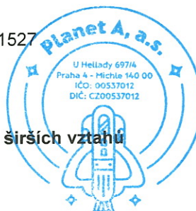
Polygon 1 - Mapa širších vztahů

Popis polygonu: plocha budoucího náměstí